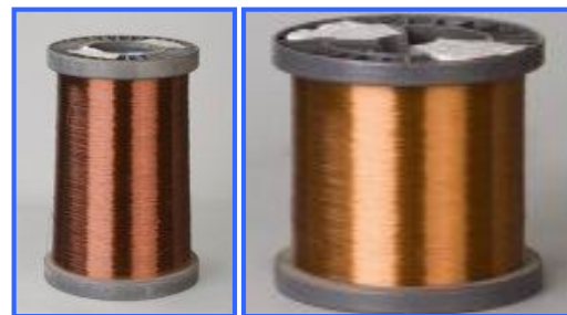
Рисунок 4. Медный провод в катушках. Слева по 5 кг, справа по 15 кг.

Поскольку при продаже медного провода за единицу измерения принимают килограмм, а при его использовании полезно знать расходуемую длину, обращаем внимание на приведенную величину удельной массы жилы на длину провода.