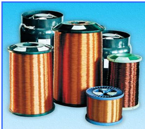
Рисунок 3. Катушки с эмалированным медным проводом.

Медные эмалированные провода поставляются на прочных пластиковых катушках. Количество провода измеряют килограммами. Медные обмоточные провода изготавливаются согласно ТУ 16-505.446-77, ТУ 16-705.110-79, ТУ 16.К71-160-92