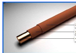
Рисунок 1. Медный провод с однослойной эмалевой изоляцией.

Условные обозначения к Рис.1 и Рис.2. 1: Медная проволока. 2: Первый слой изоляции. 3: Второй слой изоляции.